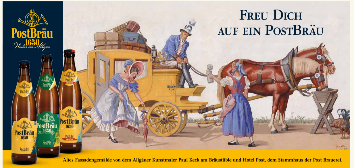
Altes Fassadengemälde von dem Allgäuer Kunstmaler Paul Keck am Bräustüble und Hotel Post, dem Stammhaus der Post Brauerei.

Die Braumalzsorten haben schwäbische und oberschwäbische Herkunft und stammen aus dem integrierten und kontrollierten Getreideanbau. Bei dieser Form der Ackerbestellung steht nicht nur der Ertrag im Vordergrund, sondern gleichsam wird auf gesunde und nicht ausgelaugte Böden sowie ein natürlich gewachsenes Korn größten Wert gelegt.