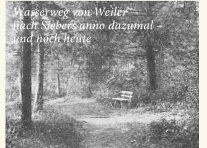
Wasserweg von Weiler nach Siebers anno dazumal – und noch heute

Brunnenhaus, das als kleines Museum dasteht wie ein antiker Wassertempel. In Erinnerung bleiben ihm die wohltuenden Eindrücke einer für sich intakt lebenden Natur sowie die Reinheit und Frische des Siebers- Mineralwassers aus der Tiefe der Allgäuer Berge.