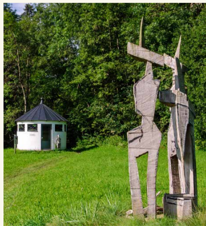
Historisches Brunnenhaus mit Kunstobjekt „Wanderer kommst Du nach Siebers“