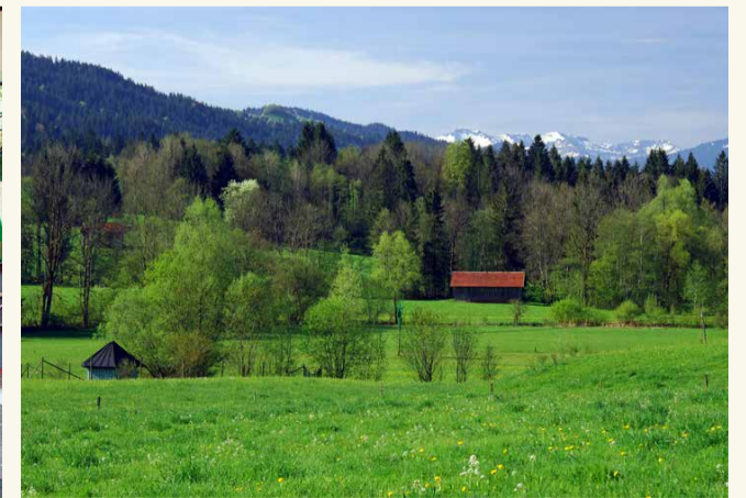
Blick auf das Siebers Wasserschutzgebiet als Teil des Naturidylls