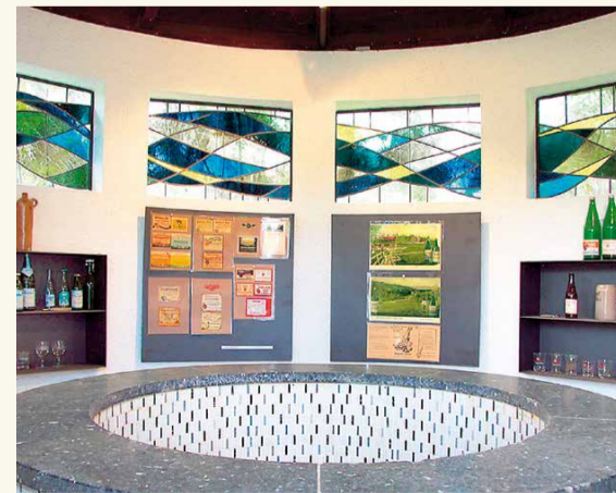
Blick ins Siebersmuseum auf die alte Brunnenfassung